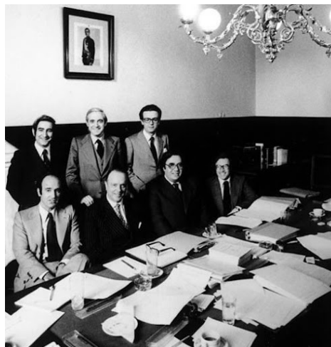
Los siete "padres" de la Constitución española de 1978.