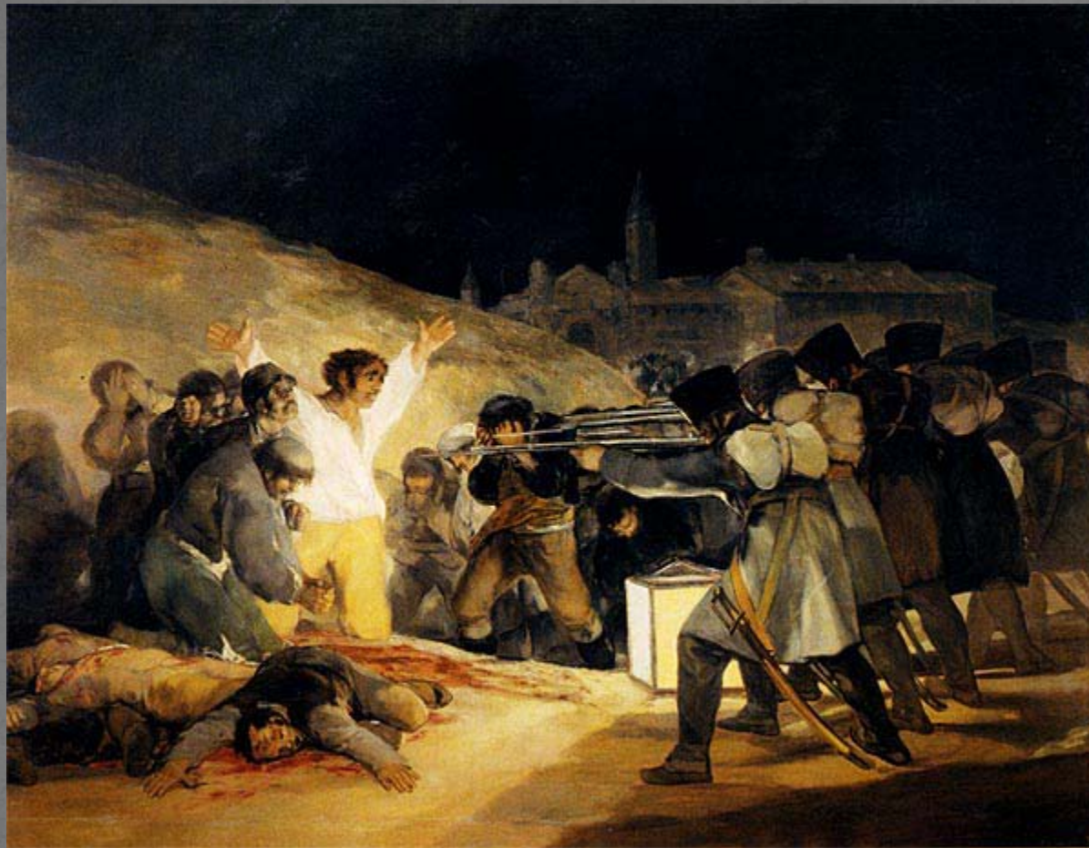
Fusilamientos del 3 de mayo. Francisco de Goya